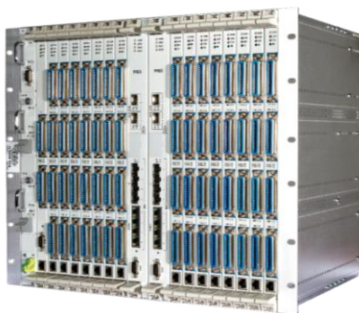
Рисунок 2 – Мультисервисная платформа MSAN MC1000-PX

В качестве стационарного оборудования для организации выносов Элтекс предлагает использовать MC1000-PX – мультисервисную платформу доступа к современным сервисам NGN сетей (Рисунок 2).