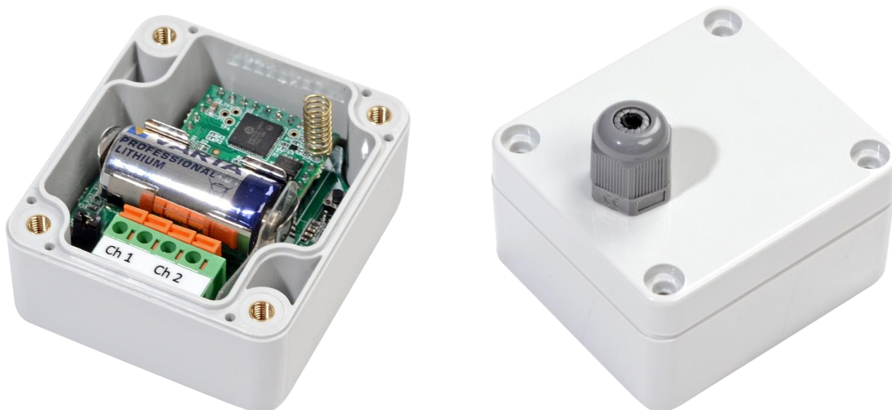
Рисунок 1 – Внешний вид SZ-W02

Регистратор SZ-W02 представляет собой микропроцессорный прибор, выполненный в пластмассовом корпусе, защищенном от воздействия внешней среды, состоящим из основной платы и платы субмодуля. На основной плате располагаются источник питания, счетные входы, световая индикация и кнопка управления. На субмодуле расположены микроконтроллер, энергозависимая память и приемопередающая антенна. Внешний вид регистратора импульсов приведён на рисунке 1.