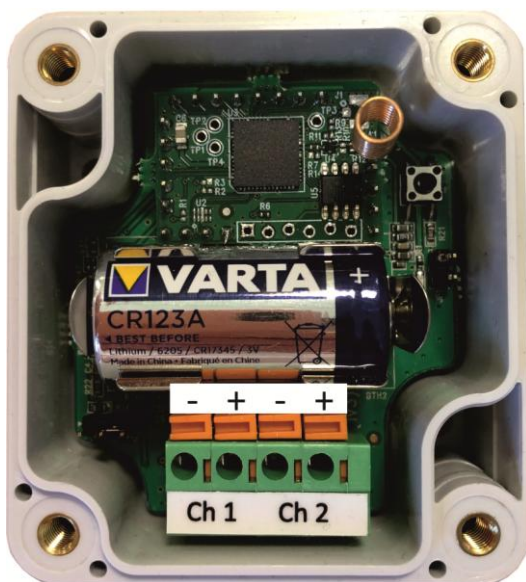
Рисунок 4 – Нумерация контактов SZ-W02

4.1 Для подключения по схеме геркона (релейная схема) установить перемычку JP2 соединив средний контакт и контакт около конденсатора С6. К зеленой колодке подключить шлейф к каналам ch1 и ch2: нажать на оранжевый фиксатор шлицевой отверткой, вставить зачищенный конец провода шлейфа до упора и отпустить фиксатор.